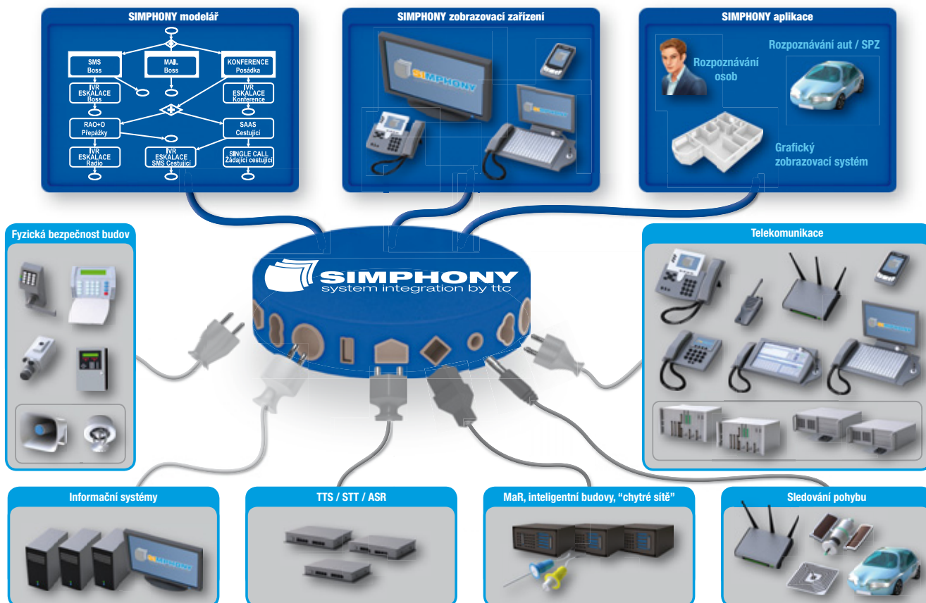
Schéma komplexního SIMPHONY řešení

Naší pozornosti neunikají příležitosti ani v oblastech jako jsou průmyslová výroba, obchod, služby, nebo instituce státní a veřejné správy.